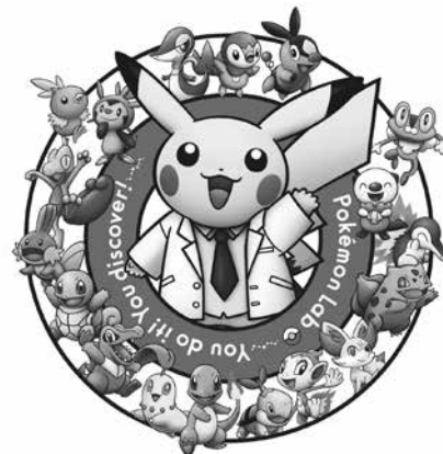
©2015 Pokémon. ©1995-2015 Nintendo/Creatures Inc./GAME FREAK inc. ポケットモンスター・ポケモン・Pokémonは任天堂・クリエーション・ゲームフリークの登録商標です。