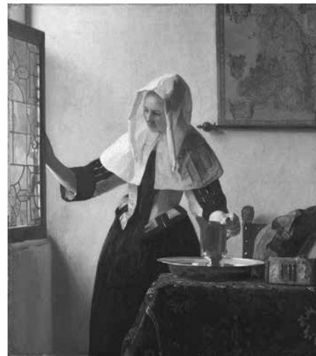
ヨハネス・フェルメール《水差しを持つ女》 1662年頃 油彩・カンヴァス、45.7×40.6 cm メトロポリタン美術館、ニューヨーク Marquand Collection, Gift of Henry G. Marquand, 1889 (89.15.21)