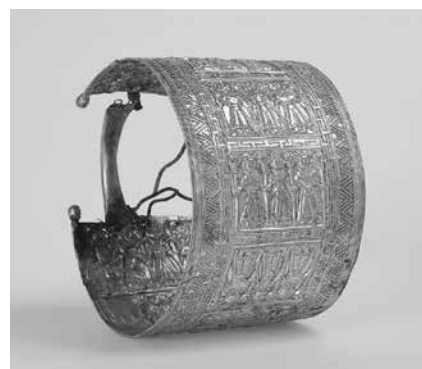
《腕輪》 紀元前675-650年/金/直径10cm イタリア、チエルヴェテリ、ソルボ墓地、レゴリーニ・ガラッソの墓出土 ヴァチカン美術館