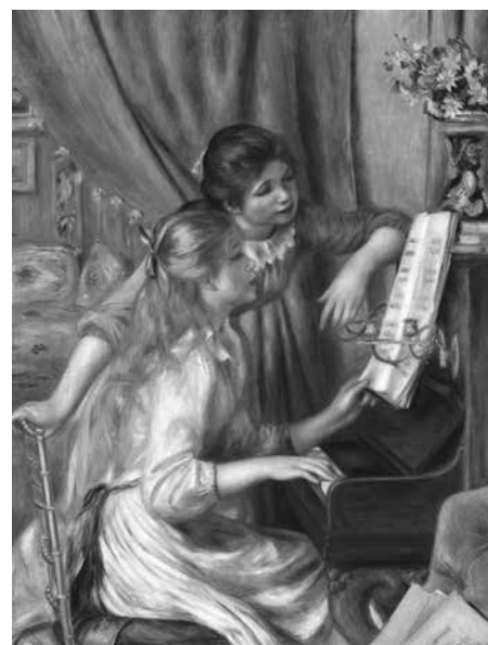
《ピアノを弾く少女たち》1892年 油彩、カンヴァス オルセー美術館