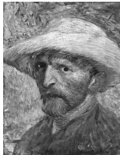
フィンセント・ファン・ゴッホ 《自画像》1887年 City of Detroit Purchase