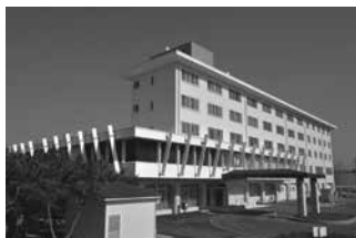
かんぽの宿 知多美浜