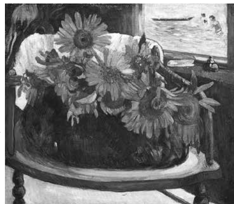
ポール・ゴーギャン 《肘掛け椅子のひまわり》 E.G. ビュールレ・コレクション財団 ©Foundation E. G. Bührle Collection, Zurich