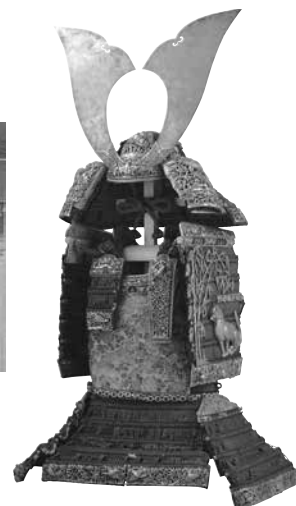
左: 春日権現験記絵(春日本) 巻第十二(部分) 江戸時代・文化4年(1807) 春日大社蔵 展示期間: 通期(場面替有) 右: 国宝 赤糸威大鎧(竹虎雀飾) 鎌倉～南北朝時代・13～14世紀 春日大社蔵 展示期間: 2/14(火)～3/12(日)