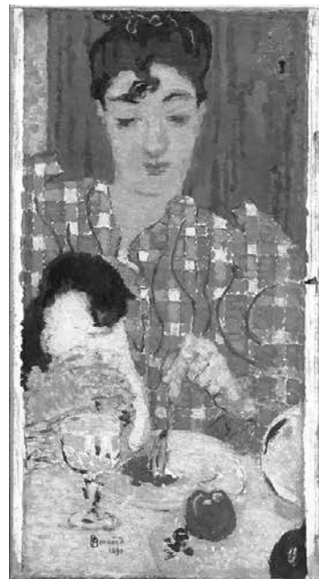
ピエール・ボナール《格子柄のブラウス》1892年油彩/カンヴァス61×33cm