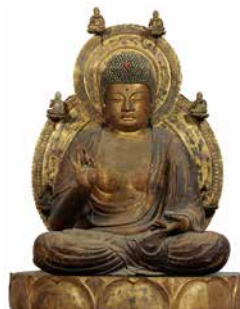
国宝「薬師如来坐像」平安時代、醍醐寺蔵、 画像提供：奈良国立博物館、撮影：佐々木香輔