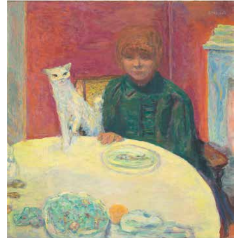
ピエール・ボナール 《猫と女性 あるいは 顔をねだる猫》 1912年頃 油彩、カンヴァス 78x77.5cm オルセー美術館