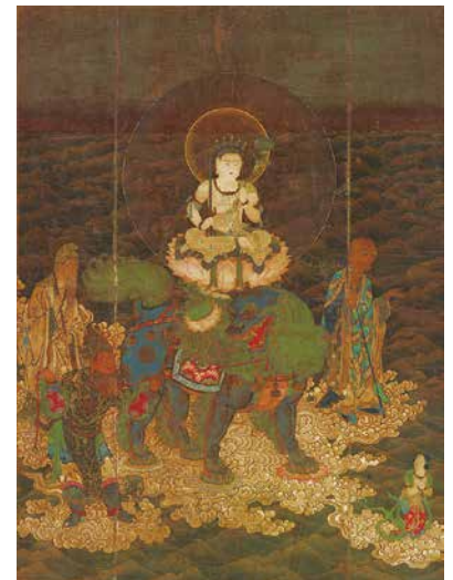
国宝「文殊渡海図」鎌倉時代、醍醐寺蔵、 画像提供：奈良国立博物館、撮影：佐々木香輔