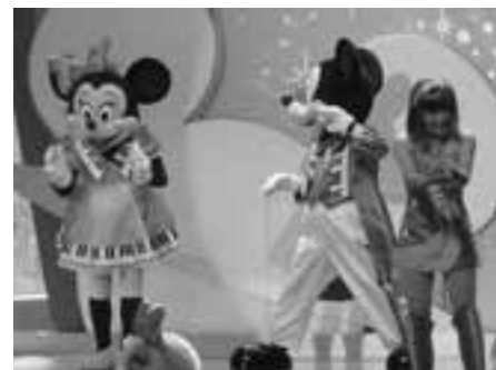
昨年のファン・パーティー

毎年好評のファン・パーティー、今年は千代田区・目黒区・台東区の3区合同で実施します。 ミッキーマウス・ミニーマウスなどのキャラクターのご挨拶とプレゼント抽選会をお楽しみ下さい。 パーティー終了後はご自由に、東京ディズニーランドで楽しく一日をお過ごし下さい。