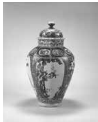
重要文化財 色絵花鳥文八角大壺 有田窯 江戸時代・1680-1710年代 サントリー美術館蔵