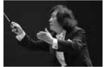
小林研一郎

指揮 小林研一郎 出演者 ヴァイオリン：瀬崎明日香 予定曲目 ベートーヴェン：ヴァイオリン協奏曲 ドヴォルジャーク：交響曲第9番《新世界より》 日時 4月13日（日）14：30 開演 会場 東京芸術劇場（JR 等各線「池袋駅」） 料金 S席 5,300円（通常料金 7,000円） 枚数 10枚（1会員2枚まで） 申込期限 2月26日（水）必着