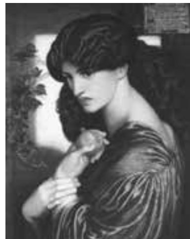
ダンテ・ゲイブリエル・ロセッティ 《プロセルピナ》(部分)1874年 © Tate, London 2014