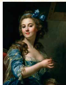
マリー=ガブリエル・カベ《自画像》 1783年頃、油彩/カンヴァス、国立西洋美術館