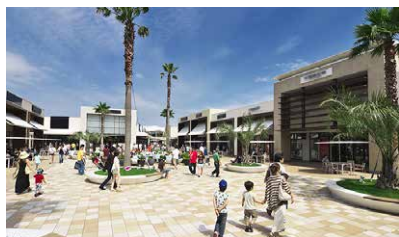
三井アウトレットパーク木更津 東京湾アクアラインで首都圏全域からのアクセスが便利。 約260店舗と、首都圏最大級のアウトレットモール。