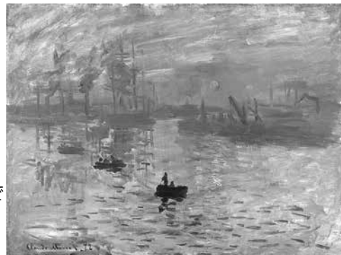
クロード・モネ 《印象、日の出》 1872年 Musée Marmottan Monet, Paris 9/19~10/18までの限定展示