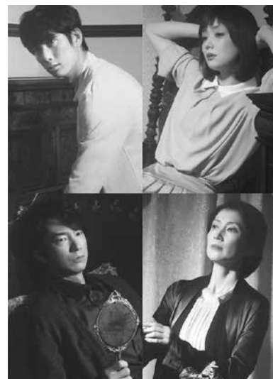
宣伝美術：相澤千晶