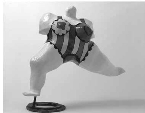
《白いダンシングナナ》 1971年 Yoko増田静江コレクション/撮影:林雅之 © 2015 NIKI CHARITABLE ART FOUNDATION. All rights reserved.