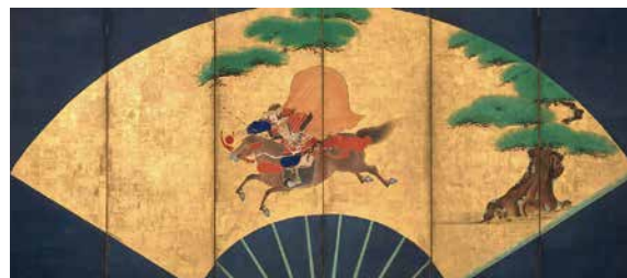
一の谷合戦図屏風 海北友雪 六曲一双のうち右隻 江戸時代 17世紀 埼玉県立歴史と民俗の博物館