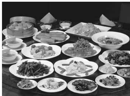
※ランチコースイメージ