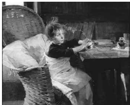
《快復期》1888年 油彩・カンヴァス フィンランド国立アテネウム美術館 Ateneum Art Museum, Finnish National Gallery