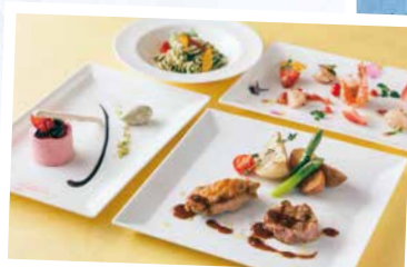
ディナーイメージ