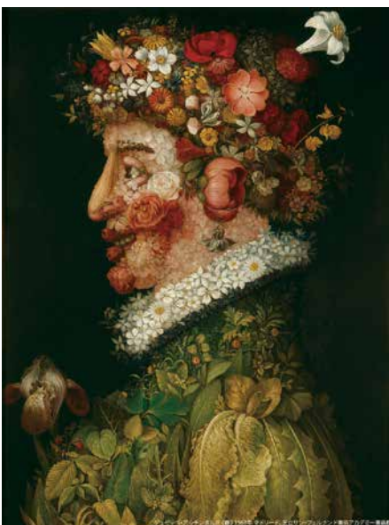
ジュゼッペ・アルチンボルド《春》1563年 マドリード、王立サン・フェルナンド美術アカデミー美術館

ジュゼッペ・アルチンボルド(1526-1593年)は、16世紀後半にウィーンとプラハのハプスブルク家の宮廷で活躍した、イタリア・ミラノ生まれの画家です。「アルチンボルド」の名は何よりも、果物や野菜、魚や書物といったモチーフを思いがけないかたちで組み合わせ、寓意的な肖像画の数々によって広く記憶されています。