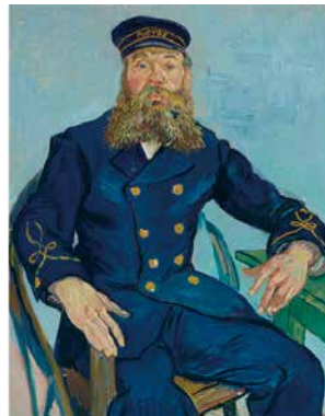
ゴッホのルーラン夫妻、 二人そろって日本へ。

● 購入方法 / 「ゆとりちよだ」窓口で会員証を提示の上ご購入ください。電話予約(取置き10日間程度・キャンセル不可)、代引配送もできます。