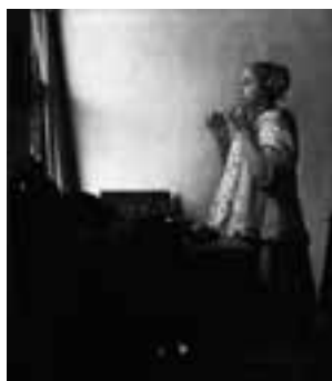
ヨハネス・フェルメール 《真珠の首飾りの少女》 1662 - 1665年頃 油彩、カンヴァス ベルリン国立絵画館

購入方法 「ゆとりちよだ」事務局窓口でご購入ください。会員の方は会員証を提示してください。