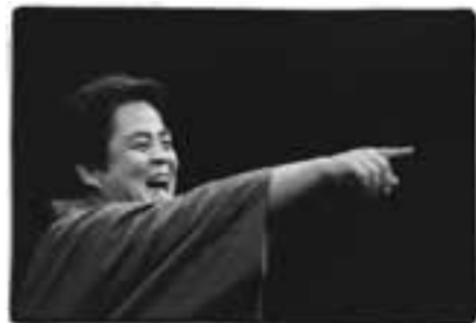
“「連二写真集 噺家 立川談春」(河出書房新書)より”

演目 「包丁」「三方一両損」 日時 5月31日（金）19：00 開演 会場 サンパール荒川大ホール （都電荒川線「荒川区役所前」東京メトロ「三ノ輪駅」） 料金 指定席 3,000 円（通常料金 3,800 円） 枚数 20 枚（1 会員 2 枚まで） 申込期限 3月21日（木）必着